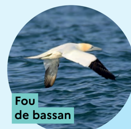
Fou de bassan